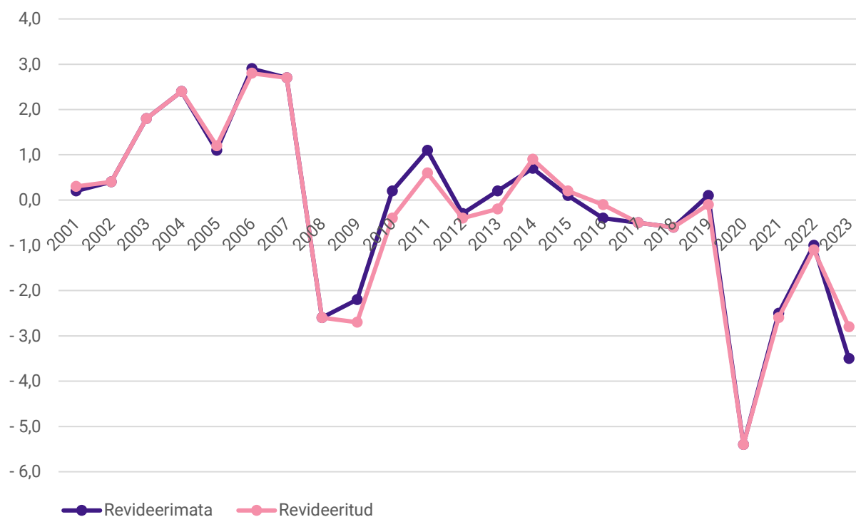
Joonis 1. Valitsemissektori eelarve üle-/puudujääk % SKP-st enne ja pärast revideerimist, 2001–2023

Valitsemissektori eelarve üle-/puudujäägi revisjoni mõjutajad on: