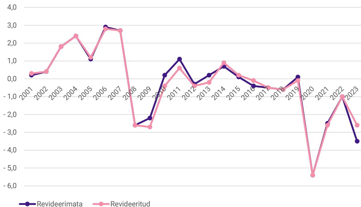
Joonis 1. Valitsemissektori eelarve üle-/puudujääk % SKP-st enne ja pärast revideerimist, 2001–2023

Valitsemissektori eelarve üle-/puudujäägi revisjoni mõjutasid enim: